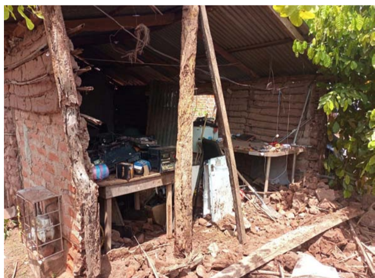
La casa, construida con paredes de barro y techo de zinc, se encuentra exactamente en la calle 18 con carrera 2.

El proyecto, licenciado y ejecutado con los más altos estándares sociales y medioambientales, está soportado por rigurosos estudios desarrollados por expertos nacionales e internacionales y fue objeto en 2016 de exhaustivas evaluaciones realizadas por la Mesa de Trabajo Interinstitucional ordenada por Tribunal Administrativo de La Guajira, la cual confirmó su viabilidad.