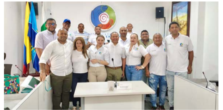
Los concejales de Riohacha esperan que lleguen los proyectos del alcalde Bermúdez para someterlos a debates.

El funcionario indicó que la administración distrital estará defendiendo los proyectos de acuerdo que presente el ejecutivo de acuerdo con los requerimientos de los concejales.