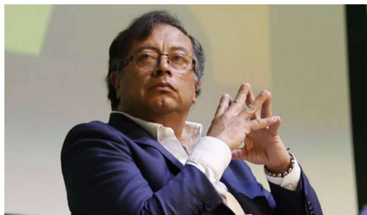
El candidato Gustavo Petro tenía previsto ofrecer un discurso hoy por la tarde en la ciudad de Pereira.