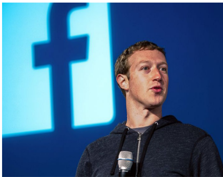
Mark Zuckerberg, creador de la red social Facebook, que hoy en día incide en las decisiones de las personas.

El poder de la desinformación es latente, debido al poco control que Facebook tiene sobre las noticias que se actualizan a cada segundo, en miles de perfiles y millones de publicaciones las veinticuatro horas del día. Los usuarios ordinarios, ignoran cómo funciona el algoritmo de la red social y por ello, cuando clickean sobre un aviso de interés