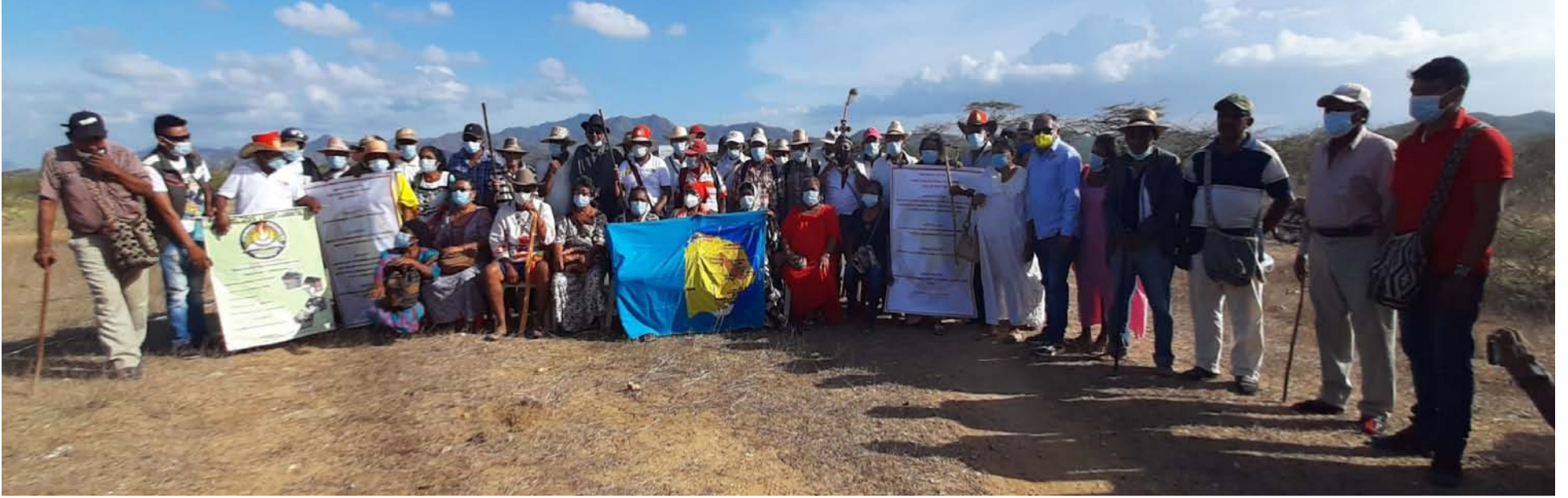
Tener una nutrida y bien fundamentada normatividad no ha servido para garantizar el bienestar de las comunidades en La Guajira.