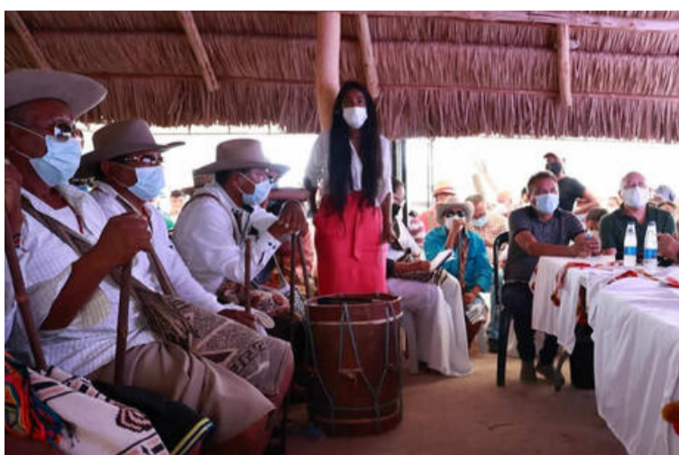
La ministra de Transporte, Ángela María Orozco, durante los encuentros con los líderes de la comunidad wayuú.

para cumplir con lo dispuesto en la Sentencia T-302, la cual consiste en cuatro compromisos principales.