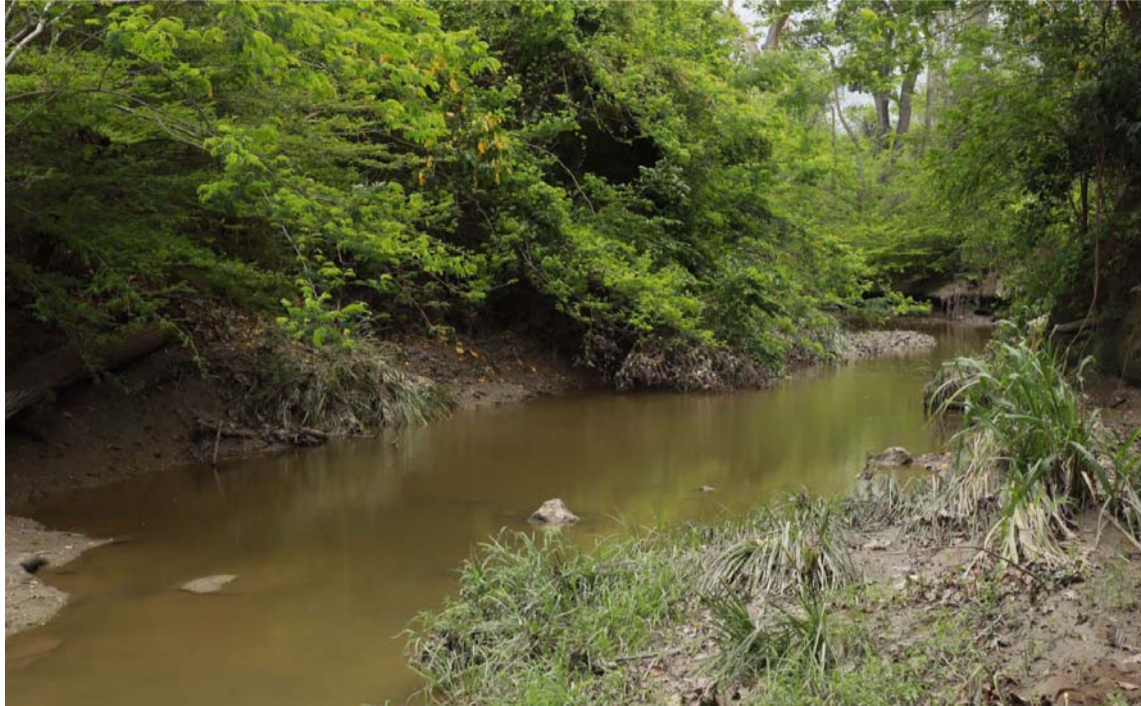
El arroyo Bruno es estacional y registra un período húmedo en meses de abril y mayo.

Hoy en día, el nuevo cauce es un ecosistema estabilizado que brinda diferentes funciones ecosistémicas en el territorio. Más de 390 especies de fauna han sido identificadas en la zona, dentro de las que se destacan cuatro avistamientos de jaguar, especie indicadora del buen estado del ecosistema, lo cual confirma que el arroyo mantiene las