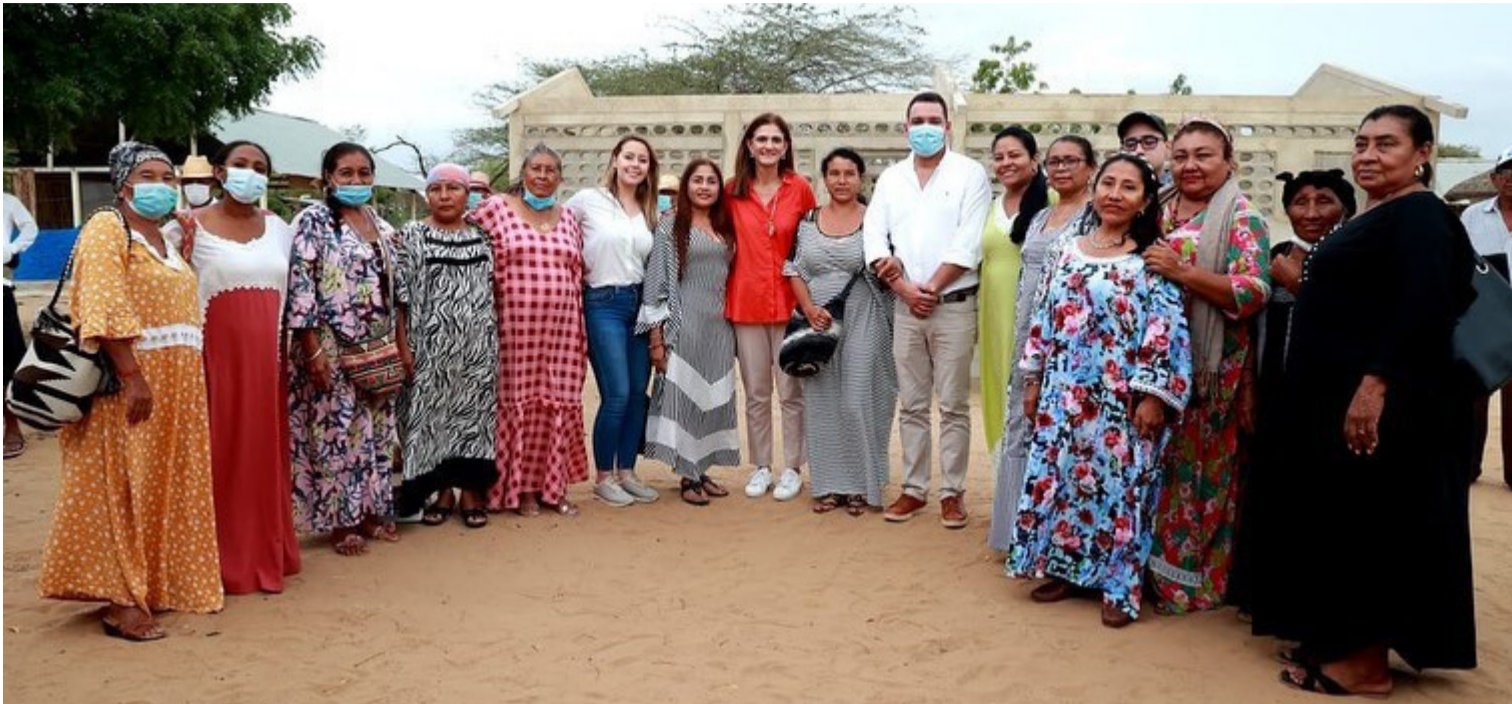
Junto al gobernador Roys, la ministra Orozco presentó a la comunidad un plan con compromisos concretos.