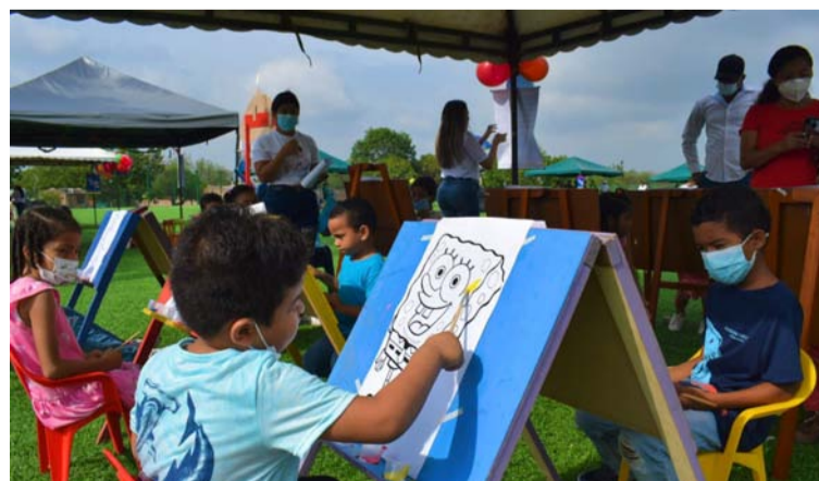
Los niños disfrutaron de actividades cargadas de cultura, arte, música, danzas, malabaristas y show canino.