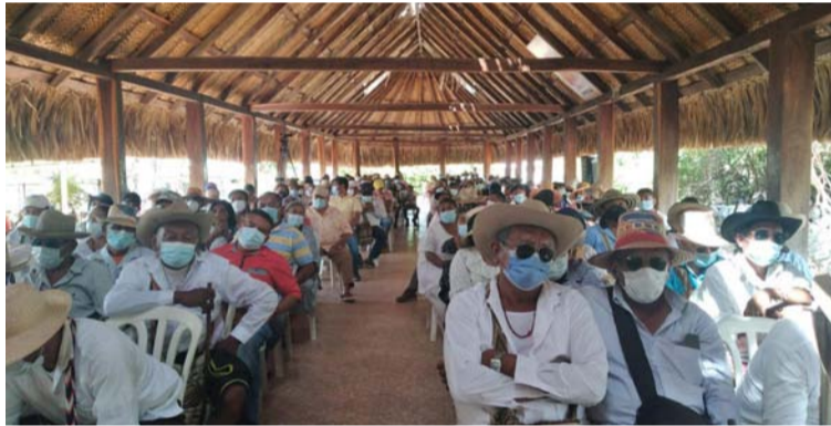
Los proyectos de inversión no obedecen a procesos de priorización y las necesidades de la comunidad.

En lo que se ha visto y reportas de cumplir el cuarto año de la formalización de la sentencia, tener una nutrida y bien fundamentada normatividad no ha servido para garantizar el bienestar de dichas comunidades en La Guajira. Independien-